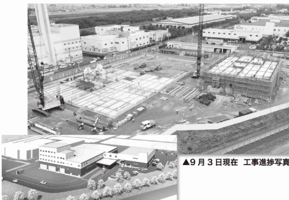
▲9月3日現在 工事進捗写真