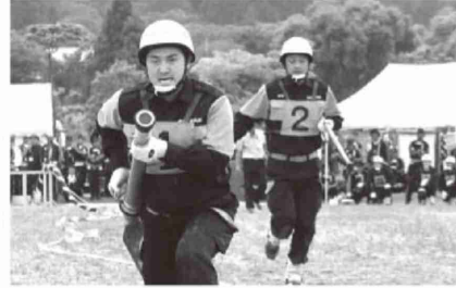
大崎支部消防操法大会 優勝 色麻町消防団