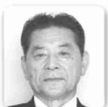
色麻町長 はやさか りえつ 早坂 利悦