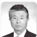
涌谷町長 おおほし のぶお 大橋 信夫