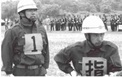
宮城県消防操法大会 出場 大崎市消防団

また、7月22日(日)には、栗原市で第50回宮城県消防操法大会が開催され、大崎支部の代表として大崎市消防団が出場し、県内各地の消防団と共に照りつける太陽の下、日頃磨き抜いた技術を披露しました。