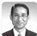
加美町長 いのまた ひろぶみ 猪股 洋文