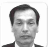
美里町長 あいざわ せいいち 相澤 清一